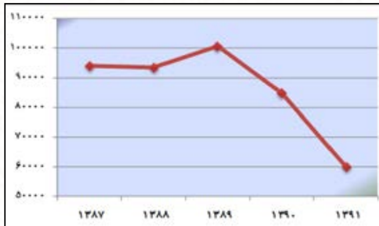
۴-۲- بررسی تولید محصولات دامی شهرستان اهواز طی سالهای ۹۱-۱۳۸۷(تن)