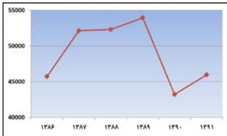
مینا: جدول ۱۲-۴