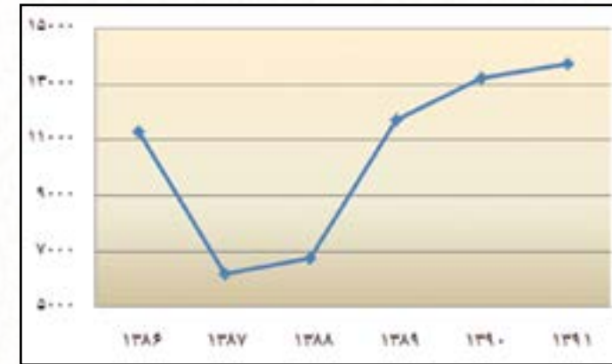
مینا جدول ۹-۴