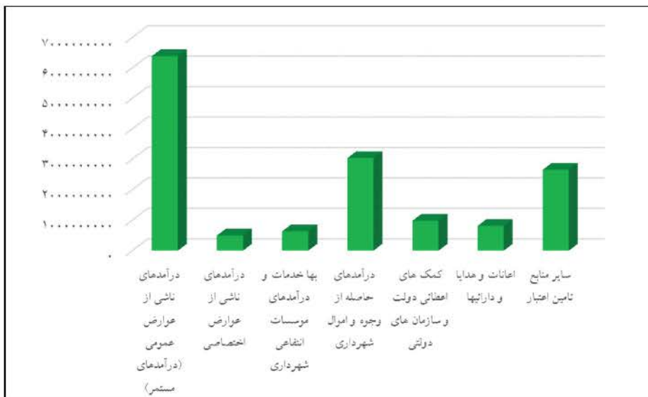
منبع: جدول ۱۸-۲